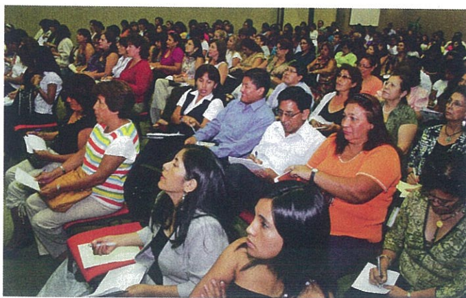
► Público ampliamente femenino aplaudió a cada una de las ganadoras del concurso organizado por La Cámara.